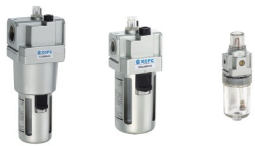
XAL5000-10 XAL4000-04 XAL1000-M5